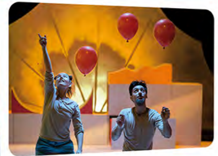
Mise en scène : Stéphane Fortin / Avec Viola Ferraris, Mattia Furlan. Scénographie, lumières : Olivier Clausse / Univers sonore : Emanuel Six

Jonglage et mouvement - Durée 35 min À PARTIR DE 2 ANS